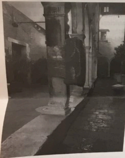
Vue de Venise, jeudi 14 novembre 2019

Dans les théories psychanalytiques, c'est au travers du stade du miroir qu'un nouveau-né prend conscience de son Moi délimité et corporel. Entre six et huit mois, quand le nouveau-né se trouve face à un miroir il reconnaît le reflet d'autrui dans la glace, généralement ses parents se trouvant à côté de lui. En identifiant ce reflet, celui de l'autre, le nouveau-né perçoit ensuite le sien propre et commence à se représenter comme un être autonome.