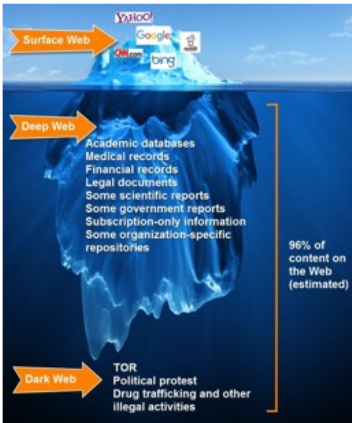
Dark Web.