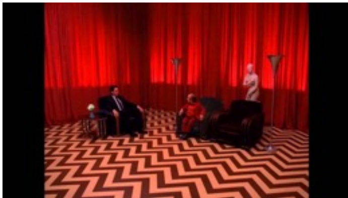
Chambre Rouge. Screen shot de Twin Peaks de David Lynch. «Selon la légende The Black Lodge est l'ombre incarnée du White Lodge. Chaque esprit doit le traverse sur son chemin vers la perfection» dialogue entre l'agent Cooper et l'assistant du shérif Hoca.