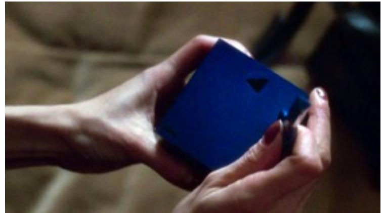
Boîte Bleu. Screen shot du film de David Lynch Mulholland Drive (2001). La boîte bleu apparait dans le film à chaque fois que le réel et le rêve se renversent dans le film.

La mélatonine - la pilule "somniafère" proposé dans la Chambre Bleu. La mélatonine est un hormone secrété par la glande pinéale, il régule les cycles de veille et de sommeil.