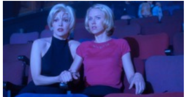
SILENCIO. Screen shot du film Mulholland Drive (2001). «Le silence contient en soi une force incroyable [...] Les rêves, je les vois rarement la nuit » David Lynch