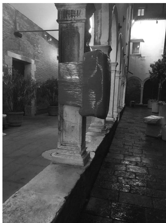
Vue de Venise, jeudi 14 novembre 2019

Dans les théories psychanalytiques, c'est au travers du stade du miroir qu'un nouveau-né prend conscience de son Moi délimité et corporel. Entre six et huit mois, quand le nouveau-né se trouve face à un miroir il reconnaît le reflet d'autrui dans la glace, généralement ses parents se trouvant à côté de lui. En identifiant ce reflet, celui de l'autre, le nouveau-né perçoit ensuite le sien propre et commence à se représenter comme un être autonome.