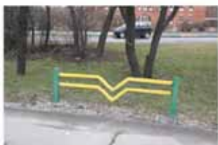
Ekaterina Vasilyeva, Les dons , 2014, collection d'environ 300 photographies, 10 x 15 cm.